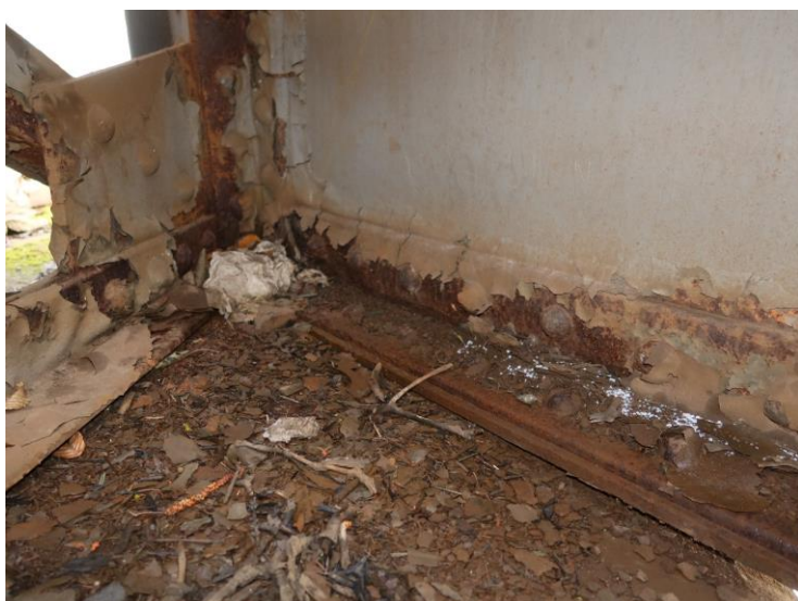
Foto č. 2 Konstrukce K 02 – levý hlavní nosník nad P 01 – korozní oslabení